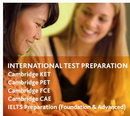
INTERNATIONAL TEST PREPARATION Cambridge KET Cambridge PET Cambridge FCE Cambridge CAE IELTS Preparation (Foundation & Advanced)