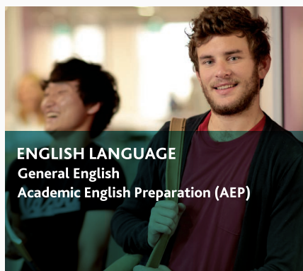
ENGLISH LANGUAGE General English Academic English Preparation (AEP)

オーストラリアで最も幅広く豊富なコースから自由に選択可能: 英語習得状況を確認しながら、さらに豊かな英語力を習得しよう